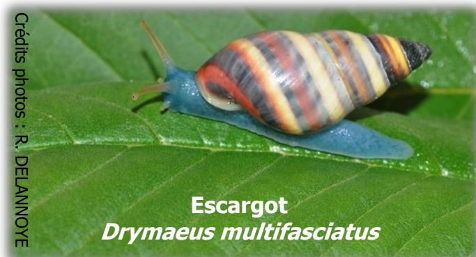
Escargot Drymaeus multifasciatus