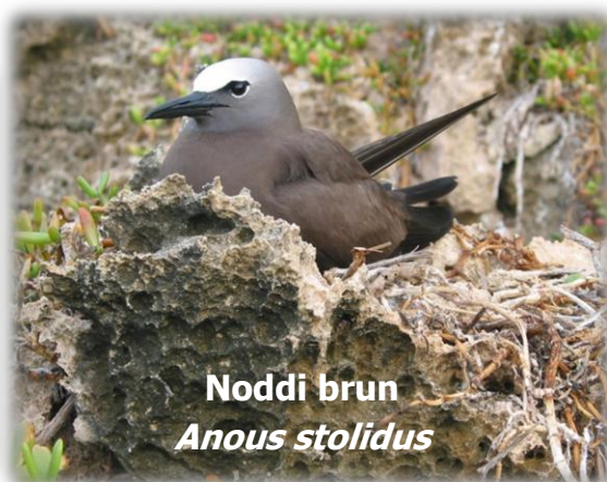
Noddi brun Anous stolidus