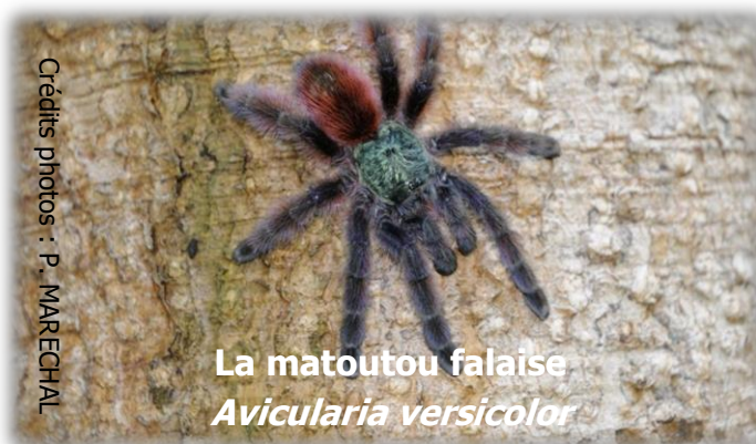
La matoutou falaise Avicularia versicolor