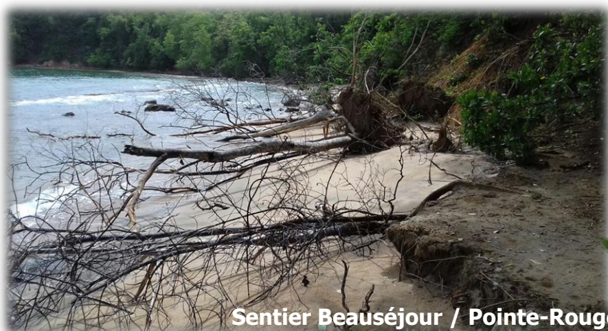
Sentier Beauséjour / Pointe-Rouge

La forêt tire son nom de la pointe rocheuse littorale au nord du site baptisée Pointe rouge du fait de sa couleur. La forêt est régulièrement fréquentée mais sans grosse affluence et sans perturbation de sa flore et de sa faune. Les plantations réalisées par l'Office National des Forêts (ONF) couvrent de petites savanes reprises à l'élevage bovin. (Source Conservatoire du Littoral)